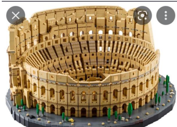
Exemple de construction possible