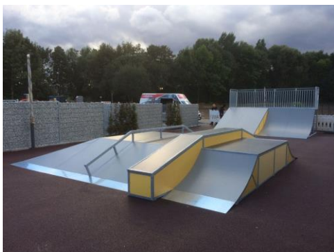
Exemple d'une fun box