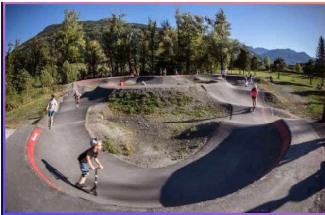
Exemple d'un pump track

Ce projet peut être porté par une association de Rochecorbon afin que ce lieu soit utilisé par différentes classes d'âge et puisse accueillir parents et enfants pour participer ensemble à des activités multiples de vélos, trottinette, roller et skate.