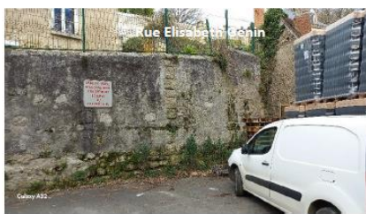
Partie la plus haute du mur (extrémité côté cavité)