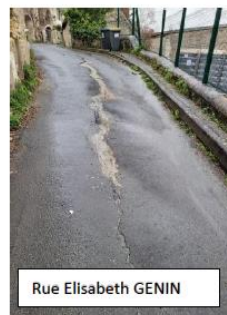
Rue Elisabeth GENIN