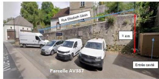
Vue du mur depuis la rue Vaufoynard