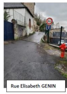
Rue Elisabeth GENIN