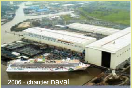
2006 - chantier naval