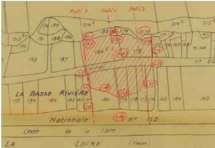
En rouge, la zone d'éboulement.