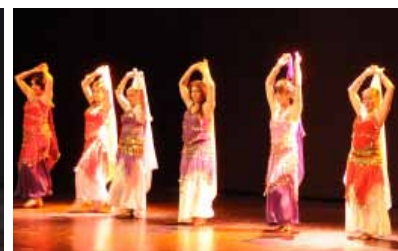
Spectacle salle Oésia - Mai 2014