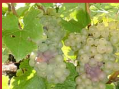
La saison des vendanges