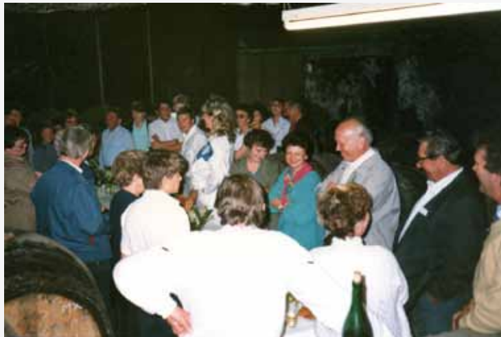
1987- accueil à la cave municipale.