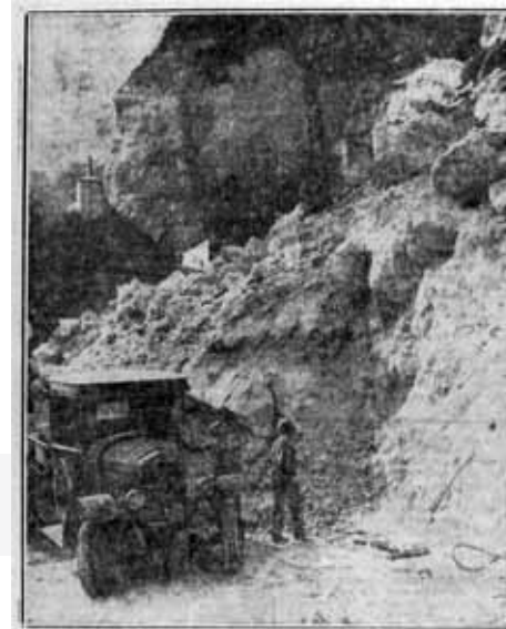
Le déblaiement du chemin des "Basses-Rivières"