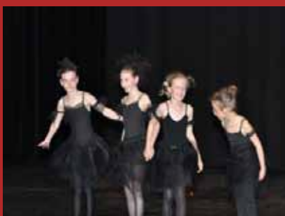
Ça bouge à Culture et Loisirs