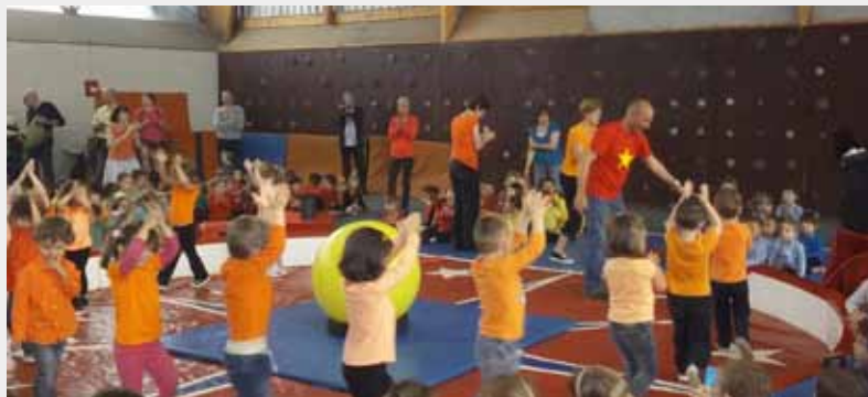
Fête de l'école - 28 juin 2014

Merci également à la Municipalité pour le prêt du gymnase et du matériel et surtout un grand merci à André et Noël, présents bénévolement comme nous depuis le lever du jour !