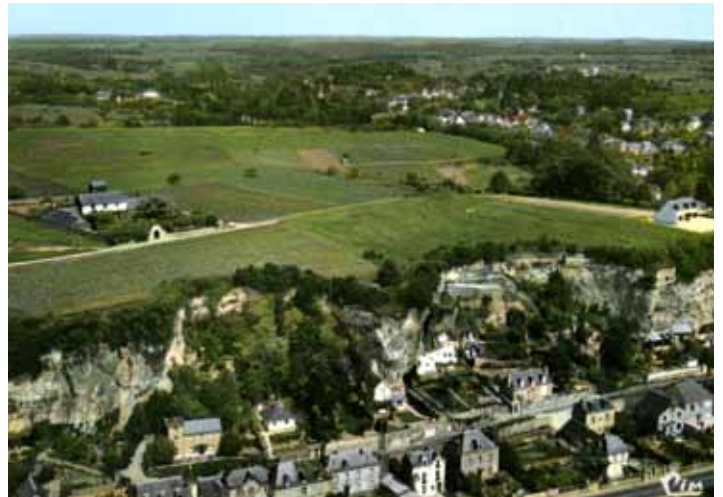
Le cirque d'effondrement forme un arc de cercle partant de l'ancienne magnanerie à droite jusqu'au dessus de la Pierre Tombée à gauche. La végétation a repris ses droits.

A l'initiative de M. Serelle, le Syndicat des sinistrés de Rochecorbon est constitué, et ouvre une souscription patronnée par toutes les autorités du département pour venir en aide aux familles sinistrées. Des petites affiches sont apposées dans les magasins de Tours. Les noms des généreux donateurs sont publiés quotidiennement par la presse locale. Le Comité de Secours aux Sinistrés de Rochecorbon organise une quête à l'occasion d'une représentation au Théâtre municipal de Tours.