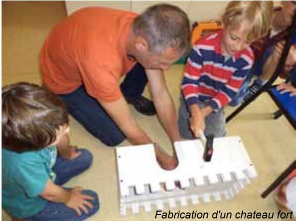
Fabrication d'un chateau fort