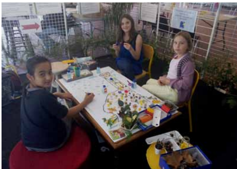
Salon du développement durable - 4/5 octobre 2014

Dans le cadre de son Agenda 21, la mairie de Rochecorbon a tenu un stand au salon de l'artisanat et du développement durable organisé par le Comité d'Animation de Rochecorbon les 4 et 5 octobre. La thématique choisie cette année était le recyclage des déchets et la récupération.