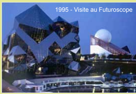
1995 - Visite au Futuroscope