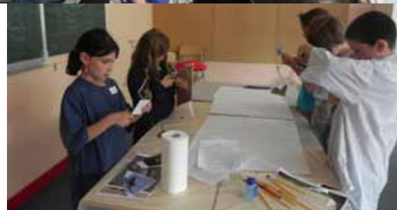
Intervention de l'association Afric'Amitié

Pour accompagner les enfants sur les différents sites ou participer à des activités, nous avons besoin de bénévoles. Si vous êtes rochecorbonnais, parents, grands parents.... Vous souhaitez accompagner les enfants et participer aux activités périscolaires, Contactez Sylvie GUERCHE, coordinatrice des TAP au 02.47.52.89.09