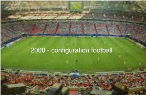
2008 - configuration football