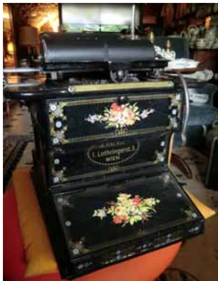
Machine à écrire Remington de 1873 (frappe invisible, décorée à la demande...)