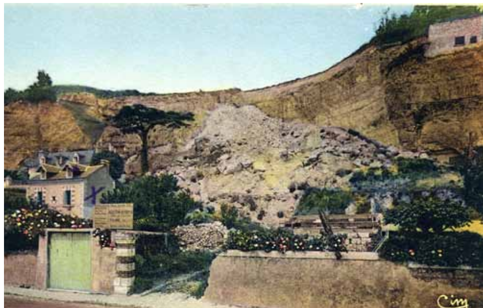
Une entreprise a déblayé les gravats de la villa "Suzanne".

Qu'on le retrouve ce coin charmant comme il était hier, comme il fut toujours pour le voyageur, l'invite au séjour sous notre beau ciel de Touraine.»