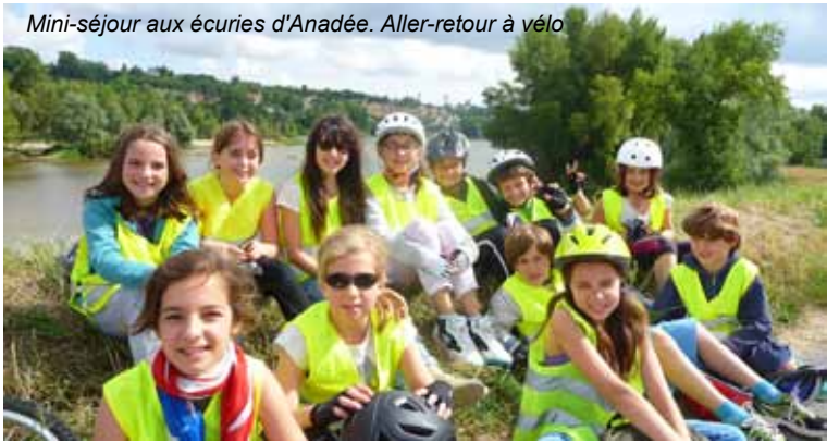
Mini-séjour aux écuries d'Anadée. Aller-retour à vélo