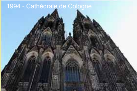
1994 - Cathédrale de Cologne