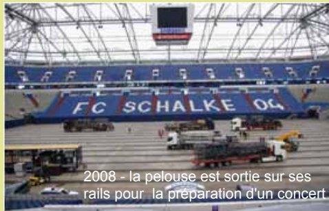
2008 - la pelouse est sortie sur ses rails pour la préparation d'un concert