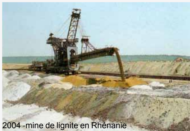
2004 -mine de lignite en Rhénanie

Je conseille à tous de participer à notre comité de Jumelage."