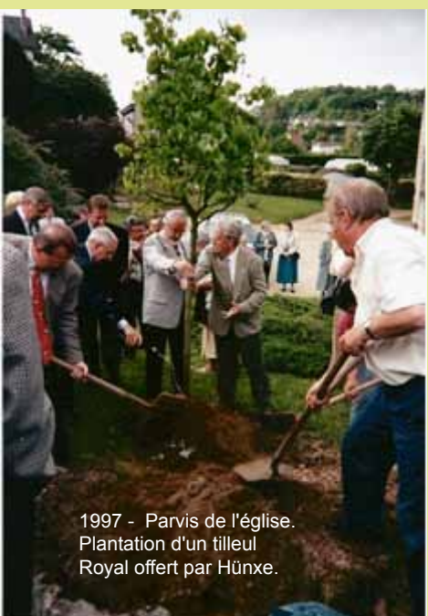
1997 - Parvis de l'église. Plantation d'un tilleul Royal offert par Hünxe.