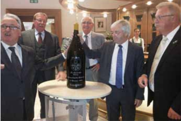
2014- Soirée officielle à Hünxe. Cadeau offert par la municipalité pour officialiser les 25 ans de nos Comités de Jumelage.

Adhérer au Comité de Jumelage vous engage pour un échange réciproque, à participer aux activités et à recevoir une famille de la ville jumelle lors de leur venue à Rochecorbon une fois par an sur un week-end de 4 jours. A Hünxe vous serez reçu par la même famille. Nous restons à votre écoute pour toutes suggestions, et à votre disposition pour tous compléments d'informations.