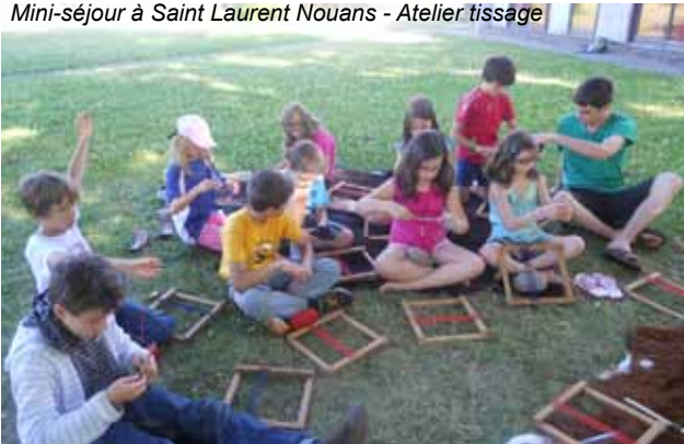
Mini-séjour à Saint Laurent Nouans - Atelier tissage