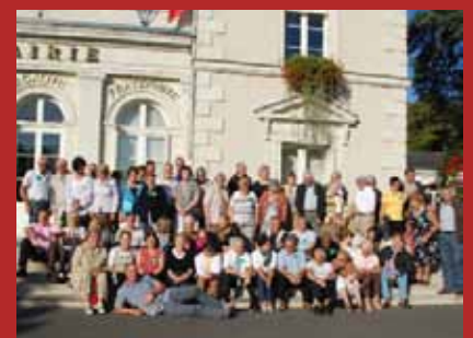
Comité de jumelage, rejoignez-nous !