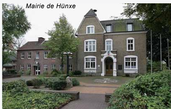
Mairie de Hünxe