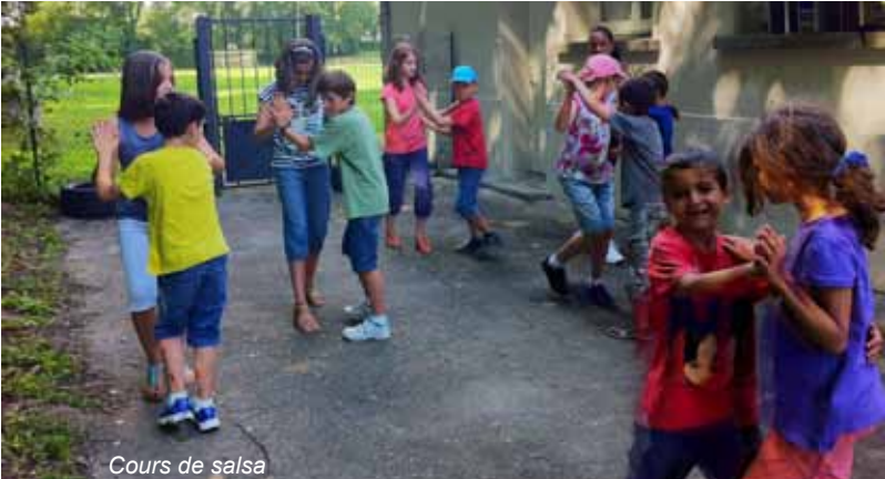
Cours de salsa