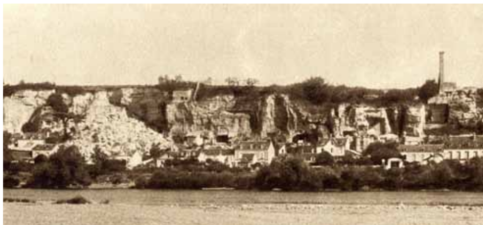
L'éboulement vu de la rive gauche de la Loire

Le lundi 16 janvier 1933 , rue des Basses-Rivières, à quelques cent mètres à l'ouest de la Lanterne, au lieu dit «la Pierre Levée», une énorme masse de terre et de rochers glisse du flanc de coteau et écrase