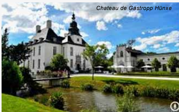
Chateau de Gastrop Hünxe

Hünxe s'étend en terrasses du nord au sud : bois et landes, prairies et champs offrent en alternance un paysage rural intact. Cette commune est très active avec une vie culturelle et sportive très riche.