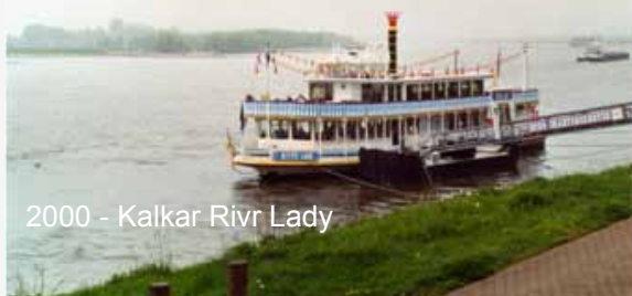
2000 - Kalkar Rivr Lady

"J'avais 15 ans la 1 ère fois que je suis allée à Hünxe c'était avec mes parents. J'y suis retournée plusieurs fois depuis. Aujourd'hui, j'en ai 40 et je ne me lasse pas de ces échanges forts enrichissants. Les hôtes sont toujours aussi accueillants et sympathiques et les visites très intéressantes. Cette année, j'ai décidé à mon tour de recevoir une famille."