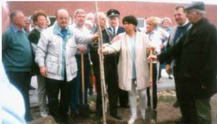
1996- Hünxe plantation de l'arbre de mai