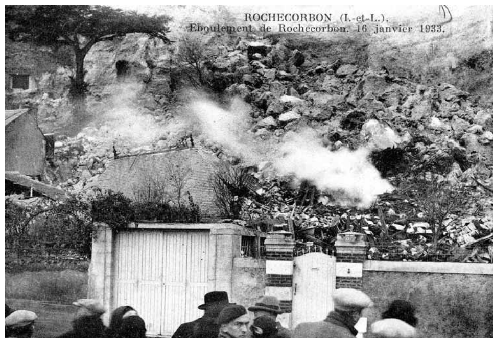
Le lendemain du drame devant la maison calcinée.