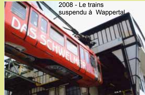
2008 - Le trains suspendu à Wappertal