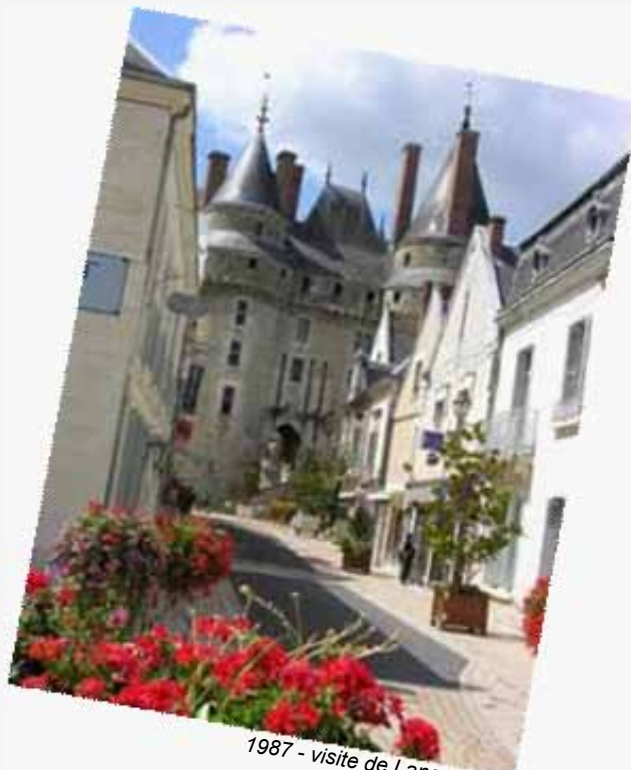
1987 - visite de Langeais