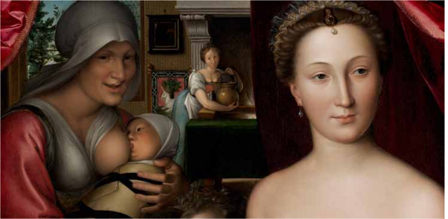
Tableau de François Clouet : 1571, La dame au bain. Jeune femme et son enfant tétant sa nourrice. Souvenir de jeunesse ?

Donc si vous aviez, en 1515, apporté votre blé à moudre au moulin de Gravotte (dans l'actuelle rue du Moulin), vous auriez entendu les premiers pleurs de celui qui deviendra le peintre officiel des rois de France.