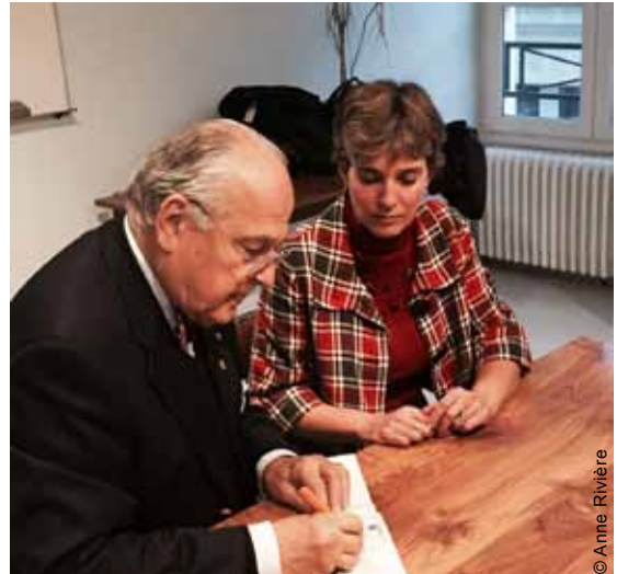
Remise d'un chèque à la coopérative scolaire par le Lion's Club