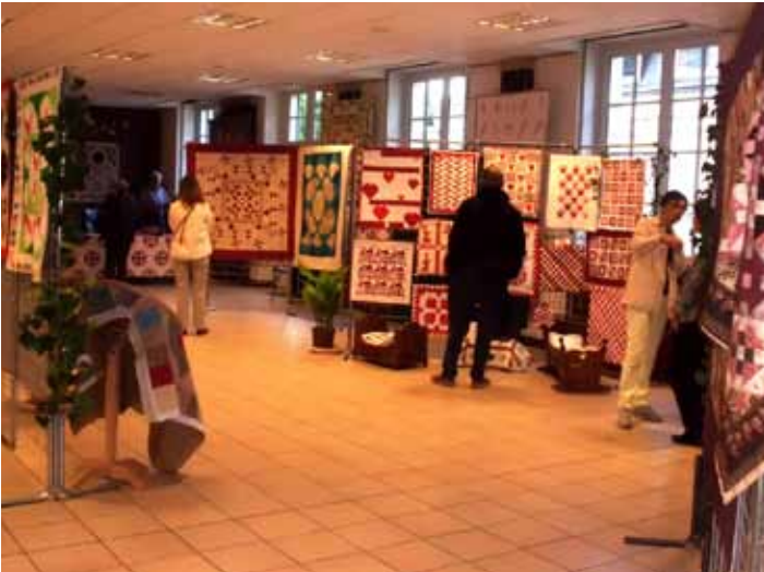
Exposition patchwork proposée par la Maison des Rochecorbonnais