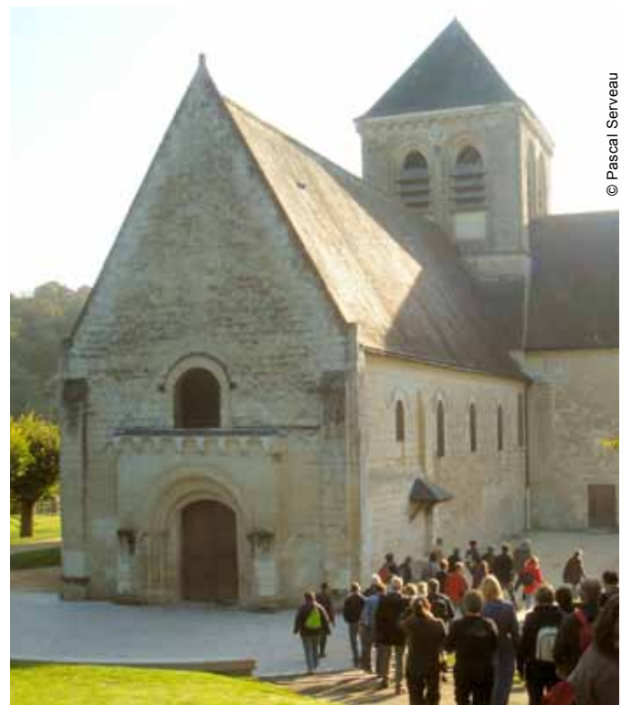
Journées du Patrimoine Marche du Patrimoine dans Rochecorbon