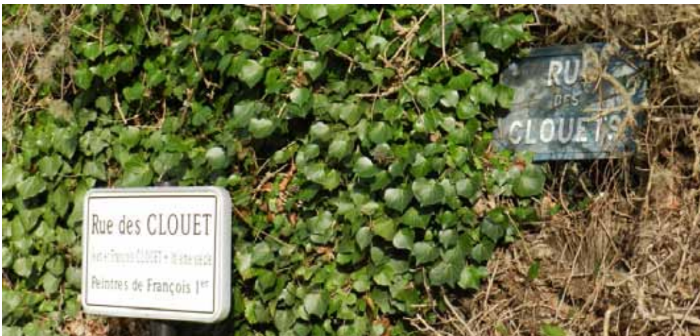
Ancienne et nouvelle plaques de rue

complète : sauf si la tradition en a institué l'usage. Ceci était le cas à Rochecorbon où, au XIX e siècle le carrefour de la « rue des Clouets » et la rue Neuve (rue du Moulin) se nommait « Carroi des Clouets ». Aujourd'hui, la dénomination légale a supprimé ce S.