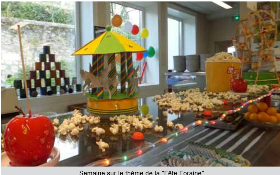
Semaine sur le thème de la "Fête Foraine"