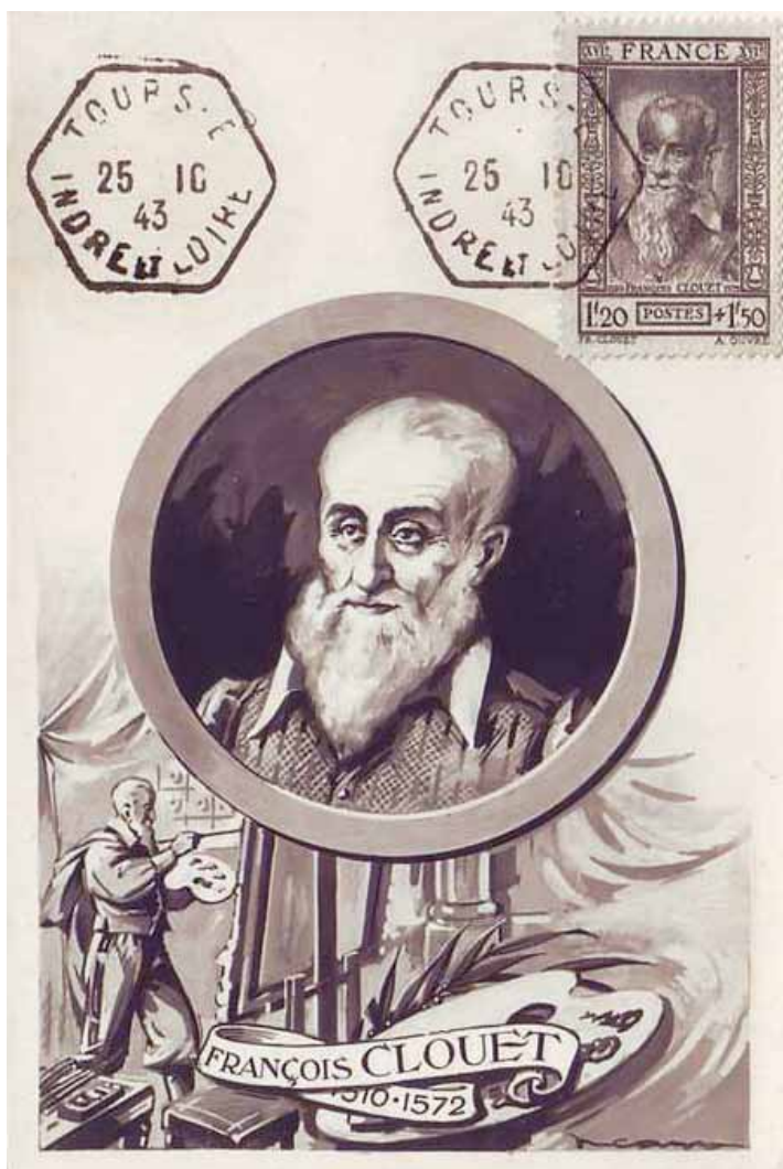
Portrait de François Clouet et timbres

Il n'y avait pas de registres paroissiaux à Rochecorbon à cette époque, nous n'avons aucune certitude, mais les spécialistes ont, par leurs travaux, déduit une année probable, 1515, qui fait consensus.