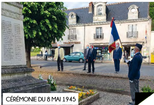
CÉRÉMONIE DU 8 MAI 1945