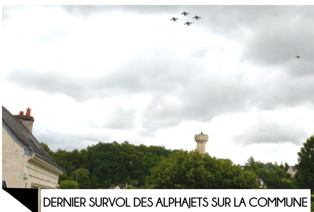
DERNIER SURVOL DES ALPHAJETS SUR LA COMMUNE