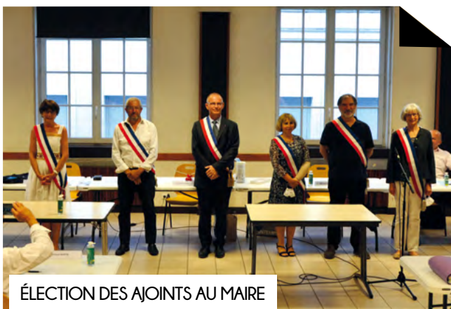
ÉLECTION DES AJOINTS AU MAIRE