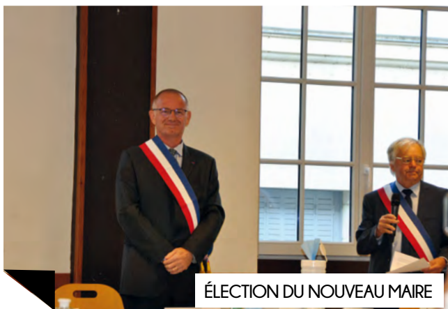
ÉLECTION DU NOUVEAU MAIRE