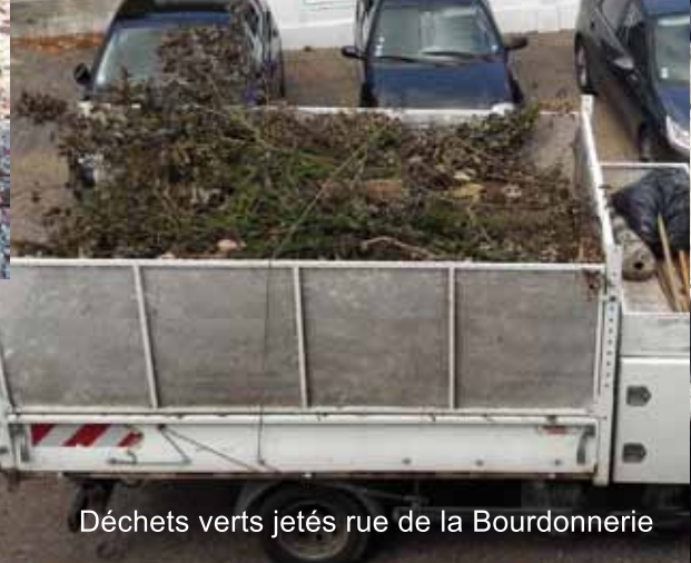
Déchets verts jetés rue de la Bourdonnerie