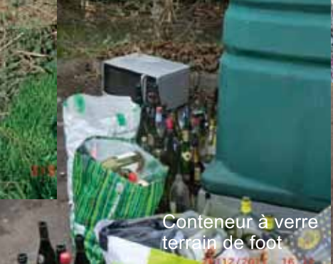
Conteneur à verre terrain de foot