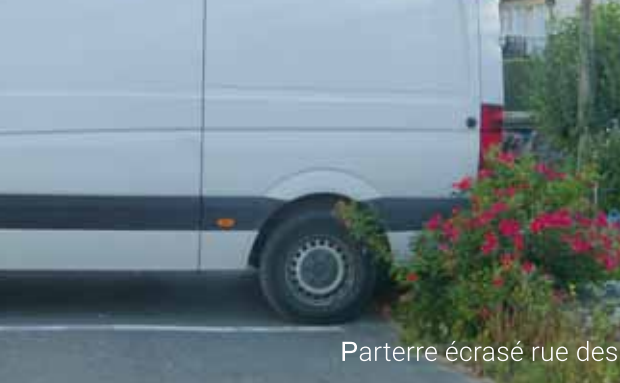
Parterre écrasé rue des Clouet