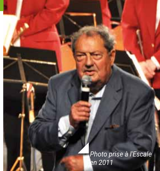
Photo prise à l'Escale en 2011