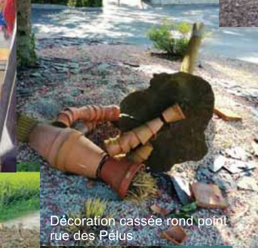
Décoration cassée rond point rue des Pélus