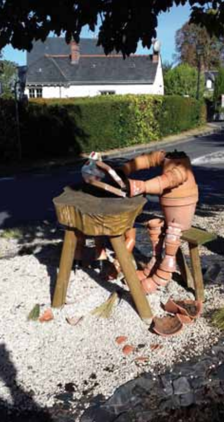
Décoration cassée rond point rue des Pélus