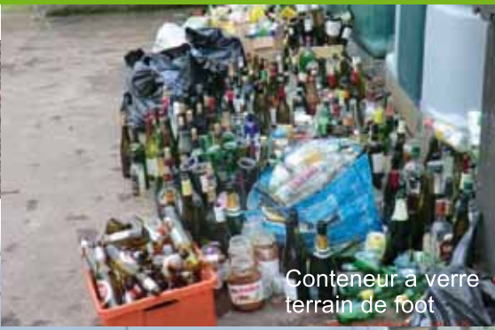
Conteneur à verre terrain de foot