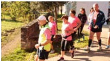
L'ASR course à pied a proposé une boucle de 5 kms. Les joggers ont rejoint les marcheurs à l'occasion de cette sortie.