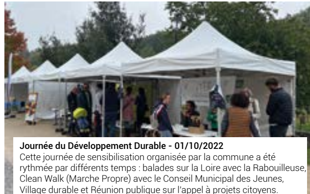
Journée du Développement Durable - 01/10/2022 Cette journée de sensibilisation organisée par la commune a été rythmée par différents temps : balades sur la Loire avec la Rabouilleuse, Clean Walk (Marche Propre) avec le Conseil Municipal des Jeunes, Village durable et Réunion publique sur l'appel à projets citoyens.