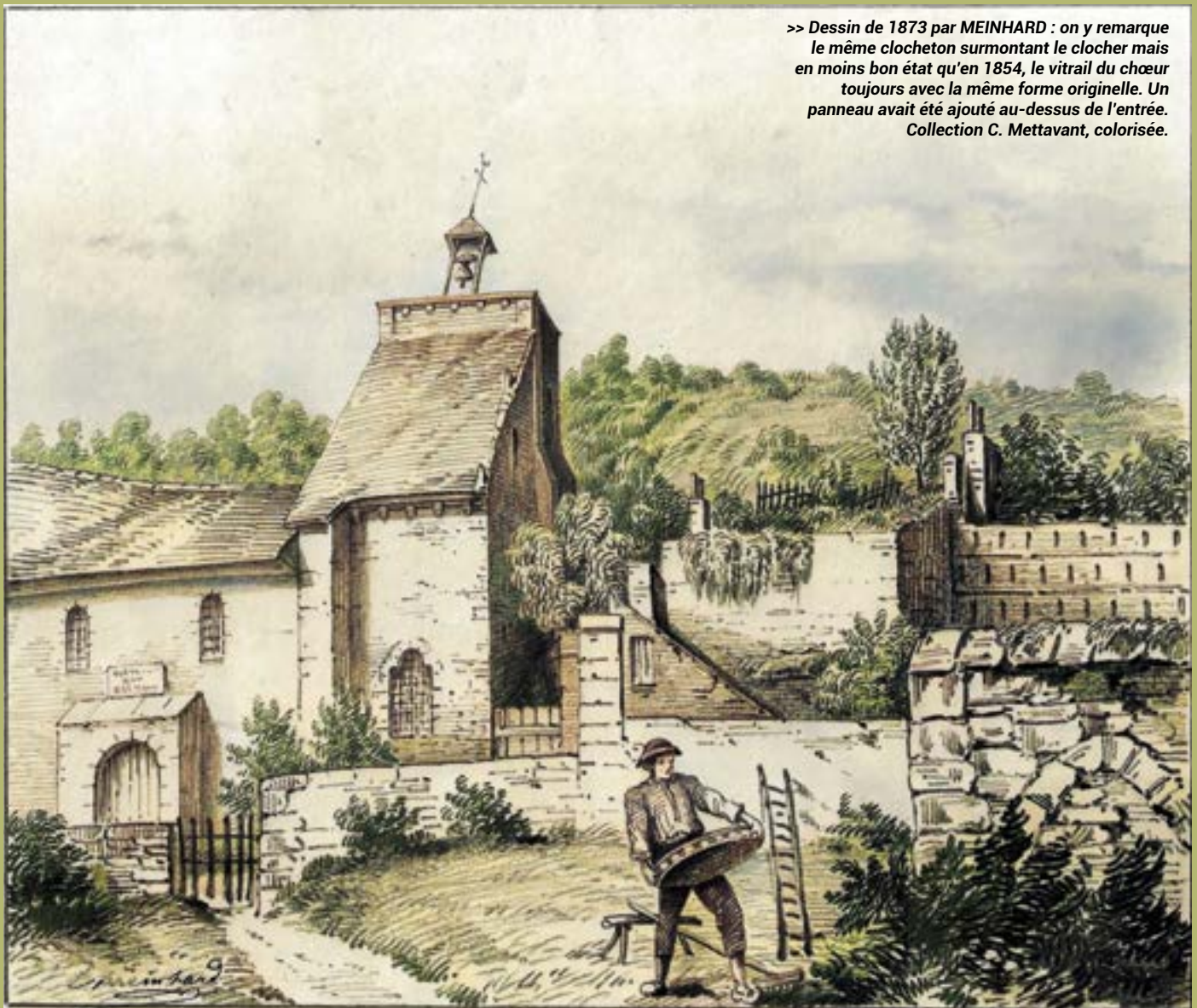
>> Dessin de 1873 par MEINHARD : on y remarque le même clocheton surmontant le clocher mais en moins bon état qu'en 1854, le vitrail du chœur toujours avec la même forme originelle. Un panneau avait été ajouté au-dessus de l'entrée. Collection C. Mettavant, colorisée.

place devant la chapelle) était loué et planté en vignes pour produire de jeunes plants. En 1822 la même idée s'imposait pour l'Église : il fallait la louer, et le tonnelier Chérot s'était dit intéressé. La Fabrique eut alors l'idée d'imposer au futur locataire d'importants travaux de remise en état : ces travaux étaient normalement imputables au propriétaire, mais ils furent ajoutés au contrat de bail, le preneur devant accepter en toute connaissance de cause. Ce bail locatif fut mis aux enchères le 21 juillet 1822, et c'est finalement le chanoine Frémin de Tours qui l'emporta avec un loyer annuel de 50 francs : il louait déjà le presbytère qui jouxtait l'Église.