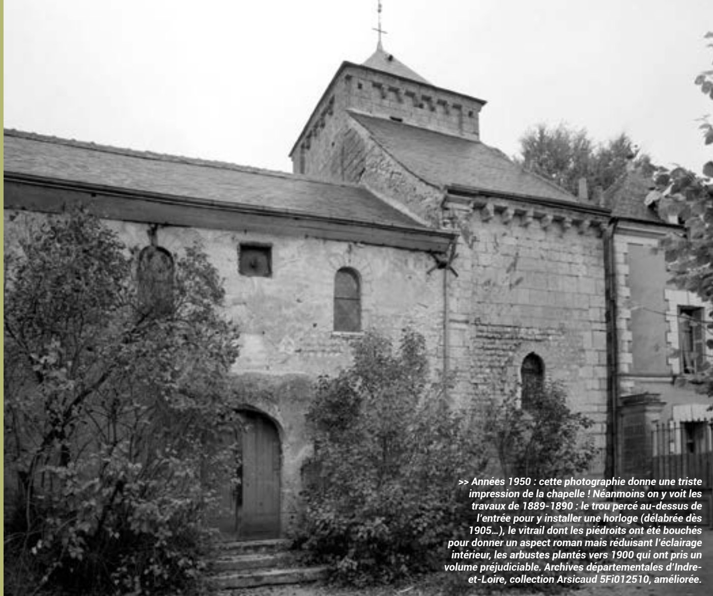
>> Années 1950 : cette photographie donne une triste impression de la chapelle ! Néanmoins on y voit les travaux de 1889-1890 : le trou percé au-dessus de l'entrée pour y installer une horloge (délabrée dès 1905...), le vitrail dont les piédroits ont été bouchés pour donner un aspect roman mais réduisant l'éclairage intérieur, les arbustes plantés vers 1900 qui ont pris un volume préjudiciable.