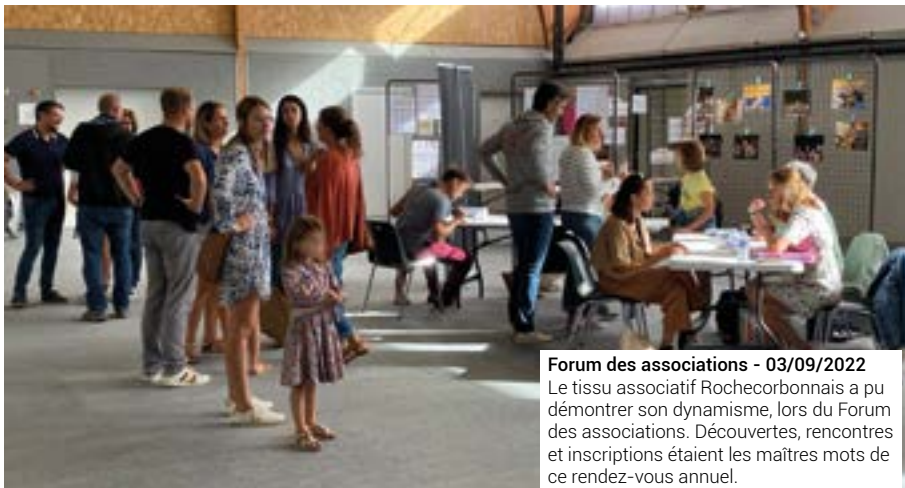
Forum des associations - 03/09/2022 Le tissu associatif Rochecorbonnais a pu démontrer son dynamisme, lors du Forum des associations. Découvertes, rencontres et inscriptions étaient les maîtres mots de ce rendez-vous annuel.