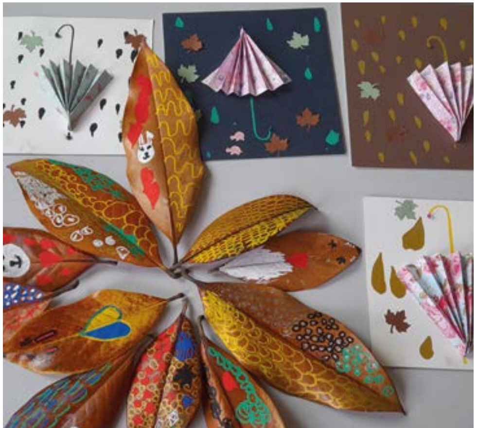
Créations automnales réalisées lors des mercredis loisirs à partir de feuilles de magolias et de papiers imprimés