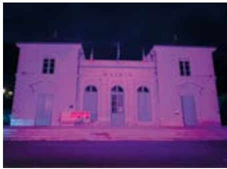
La Mairie en soutien à la lutte contre le cancer du sein a été illuminée de rose tout le mois d'octobre.