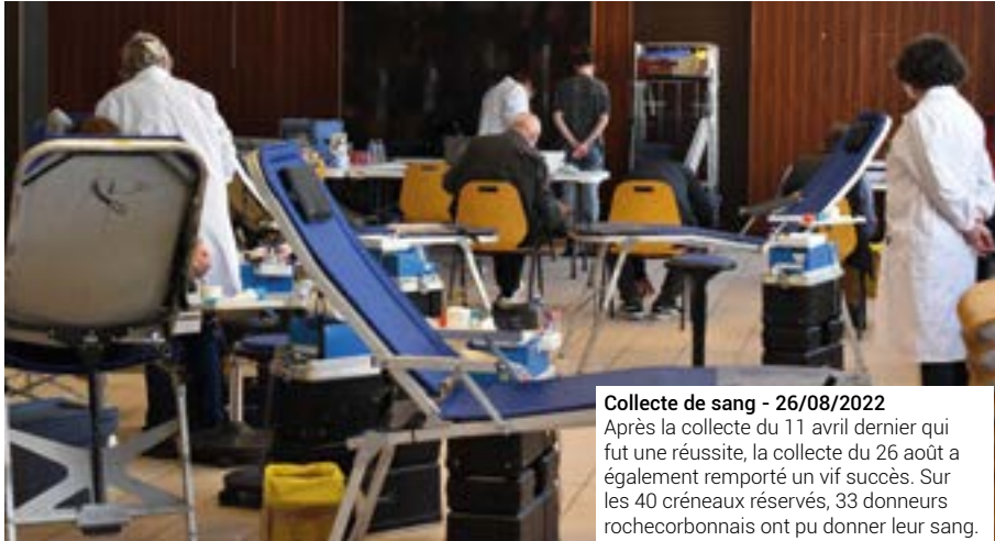
Collecte de sang - 26/08/2022 Après la collecte du 11 avril dernier qui fut une réussite, la collecte du 26 août a également remporté un vif succès. Sur les 40 créneaux réservés, 33 donateurs rochecorbonnais ont pu donner leur sang.