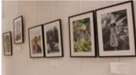
L'exposition Portraits de roses de Sarah Matignon témoignait à travers des portraits, du combat mené par dix femmes pour vaincre la maladie.