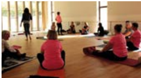
La séance de yoga a apporté aux participantes bien-être et sérénité.