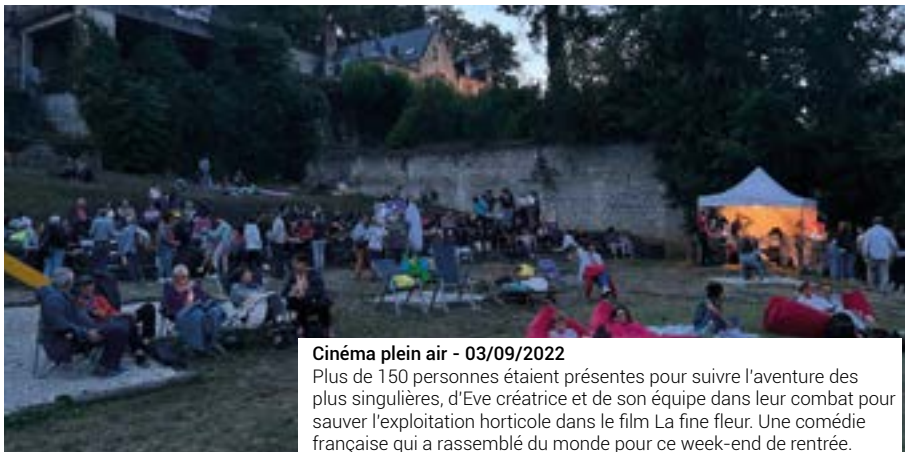
Cinéma plein air - 03/09/2022 Plus de 150 personnes étaient présentes pour suivre l'aventure des plus singulières, d'Eve créatrice et de son équipe dans leur combat pour sauver l'exploitation horticole dans le film La fine fleur. Une comédie française qui a rassemblé du monde pour ce week-end de rentrée.