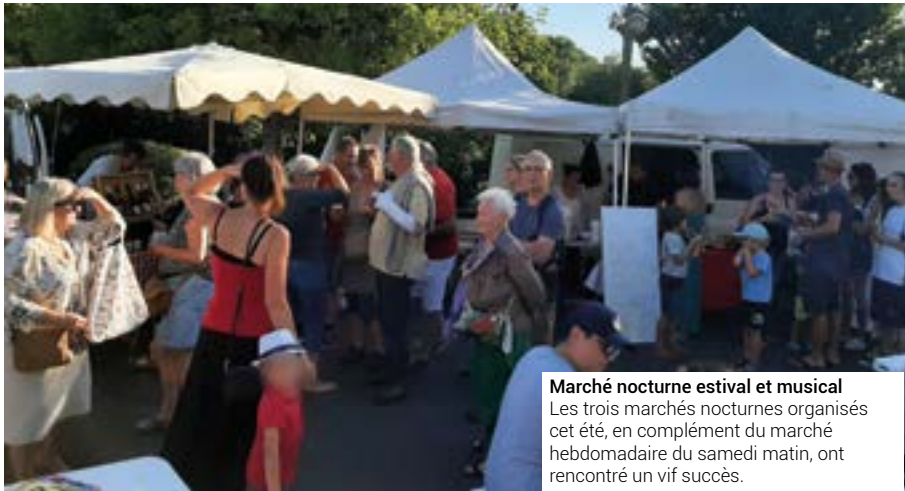
Marché nocturne estival et musical Les trois marchés nocturnes organisés cet été, en complément du marché hebdomadaire du samedi matin, ont rencontré un vif succès.