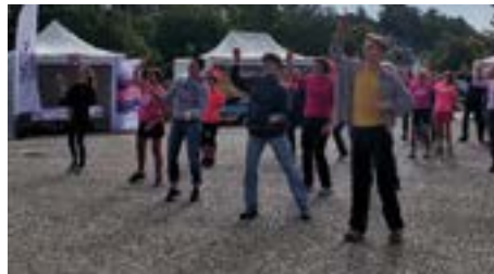
La zumba a rencontré un vif succès sur la place de l'Église.