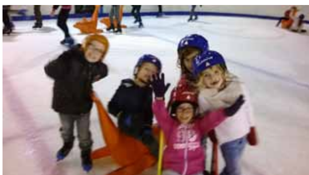
Sortie à la patinoire de Joué les Tours