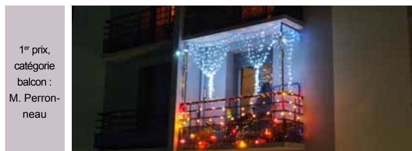
1 er prix, catégorie balcon : M. Perron- neau