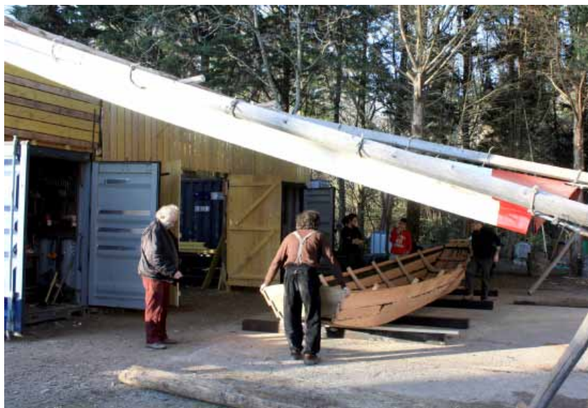
Chantier Bachi - Bouzouk de Loire

Les Bachi - Bouzouk étaient des mercenaires au service de l'empire Turc, on ne s'en souvient guère. Le mot, lui-même aurait peut-être sombré dans l'oubli sans Hergé et les insultes du Capitaine Haddock. Désormais, sur la Loire, on sait que « Bachi » et son jumeau « Bouzouk » sont les 2 bateaux-écoles de « La Rabouilleuse-Ecole de Loire ».