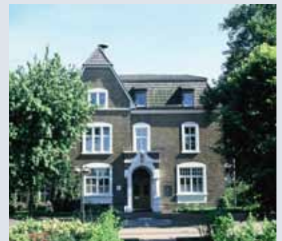
Mairie de Hünxe

Pour tout renseignement complémentaire, contactez le Président.