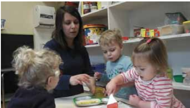
Atelier Galette des Rois : les enfants ont confectionné puis goûté la galette. Sur le même thème ils ont décoré une couronne avec de la peinture