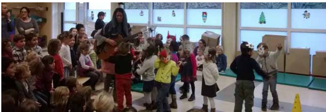
Spectacle présenté par les enfants de maternelle sur le Temps d'Accueil Périscolaire (réalisation des costumes, mîmes, chants ....)