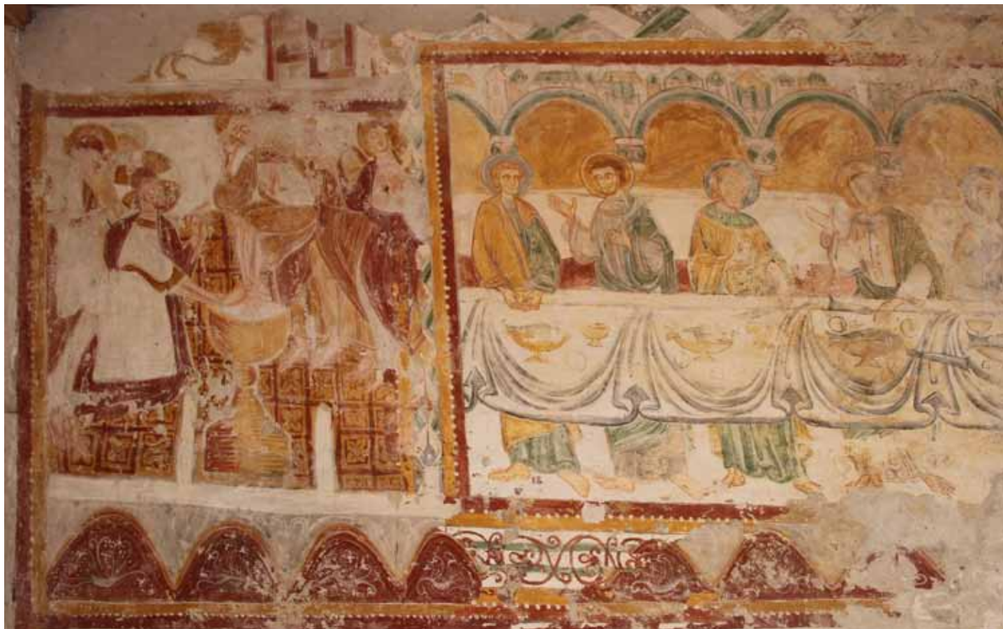
La fresque (à gauche) et la peinture de la Cène sur le mur nord de la Chapelle

Cependant cette opération ne doit pas être exceptionnelle, elle démontre d'abord, l'importance de la solidarité de tous, mais aussi le rôle des Associations : sans l'existence des Amis de la Chapelle, on peut craindre que cet édifice aurait disparu depuis longtemps. Mais il reste beaucoup à faire et nous ne pouvons qu'encourager tous ceux et celles qui le souhaitent, à nous rejoindre. Rappelons que le chœur possède un superbe vitrail du XIIIe siècle dont l'état exige une restauration, sachez que la modeste contribution des cotisations (15 euros, dont 66% déductibles des impôts) des adhérents permet de financer partiellement ces opérations. C'est le cas de la datation des peintures, ce pourra l'être pour le vitrail.