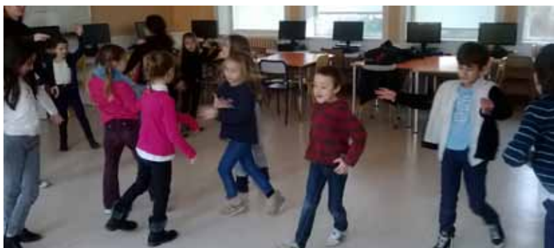
Activité danse contemporaine - expression corporelle