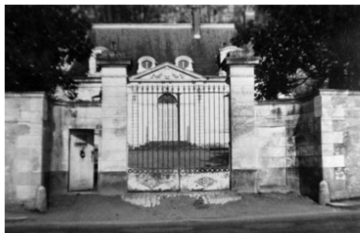
Le Portail des Basses Rivières vers 1960, avant son remplacement par celui des Dames de l'Union Chrétienne.

Aujourd'hui cette grille a retrouvé une splendeur qu'elle n'a peut-être jamais eue. Les services de l'Etat (DRAC, Monuments Historiques, Bâtiments de France) ont été prévenus de cette retrouvaille. La grille devrait retrouver son classement au patrimoine, non plus à Tours, mais à Rochecorbon ; notre Commune déjà privilégiée par son histoire, et ses monuments classés, s'enrichira d'une pièce supplémentaire. Merci à ceux qui, par leurs investissements locaux, permettent de telles réussites. L'histoire de ce Manoir sera contée dans ma prochaine publication : « Le Manoir des Basses Rivières, à Rochecorbon » qu'on trouvera à la Librairie du Centre Bourg.