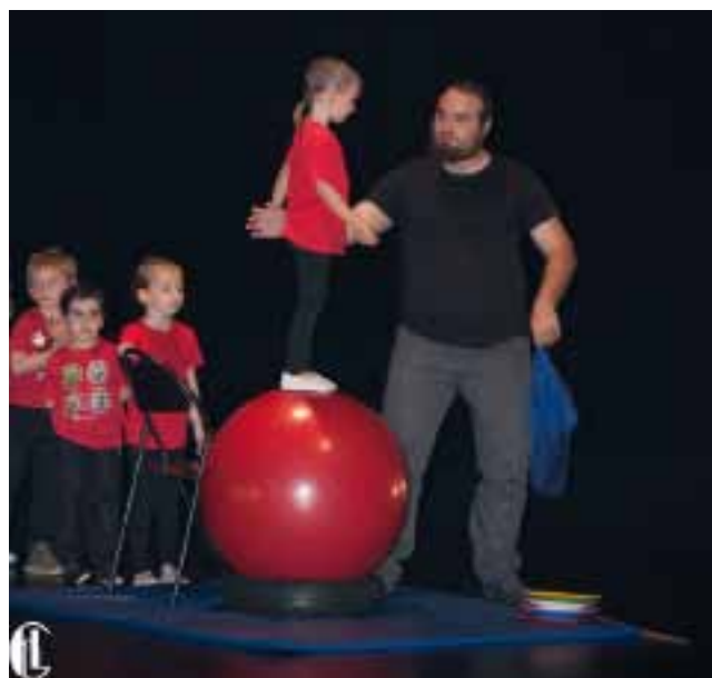
Gala de Danses du 29 mai 2016 - Salle Oésia

Pour tout renseignement contactez la Présidente comite-animation-rochecorbon@outlook.fr ou sur notre Facebook