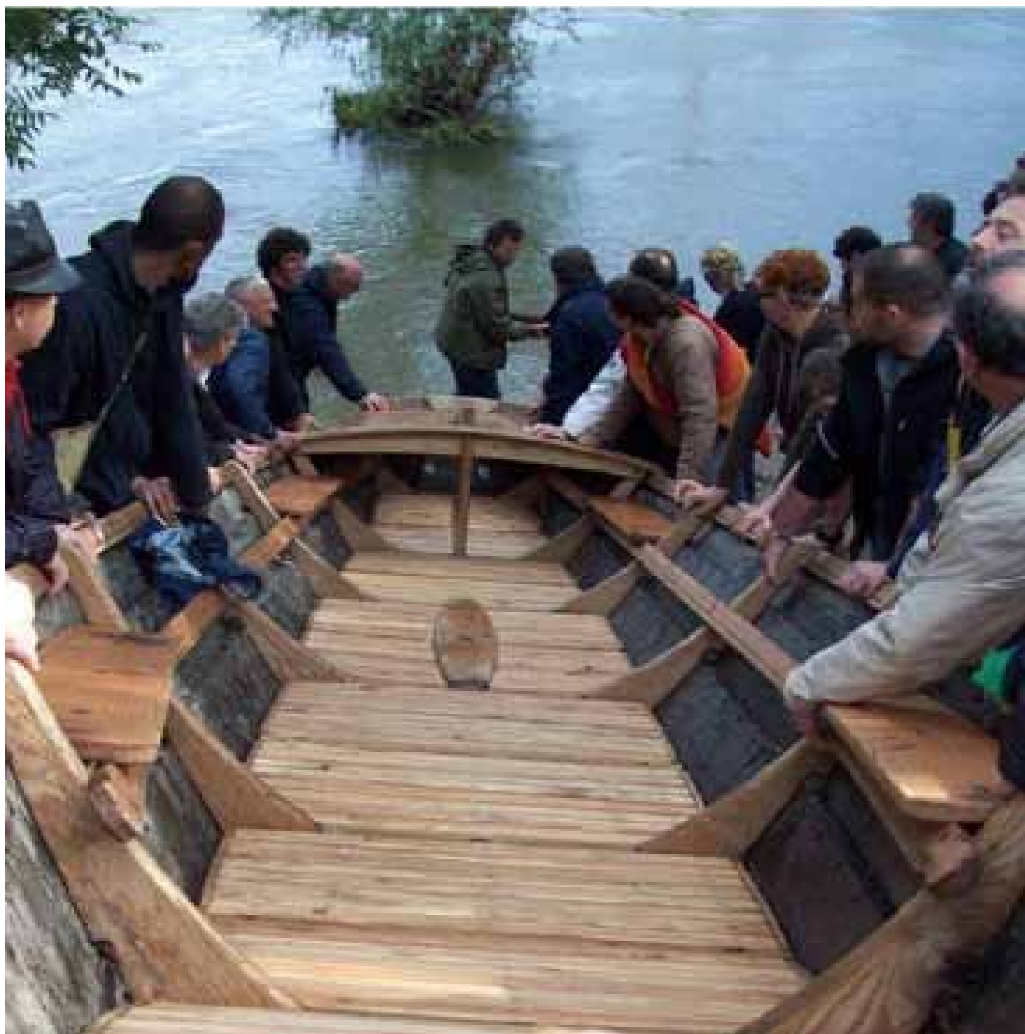
Festival "La petite Mussette" par La Rabouilleuse

Journal Municipal - Juillet à Octobre 2016 - N°27