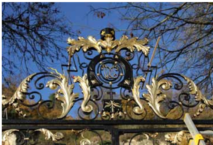
La grille lorsqu'elle était encore rue de Lucé vers 1950

le commentaire qui l'accompagne confirme sa dernière position connue, rue de Lucé, mais signale que cette grille est perdue voire détruite. Que s'était-il passé ? Les responsables de la ville de Tours cherchèrent à doter le musée d'Espélosin de tous les atouts permettant d'accroître sa fréquentation et de le rentabiliser ; tout d'abord ils le dotèrent de riches collections fournies par l'héritage du donateur mais aussi prélevées au musée des Beaux-arts de Tours. L'extérieur était entretenu par les équipes des Jardins de la ville. On déposa la grille d'entrée que l'on remplaça par celle de la rue de Lucé ; il s'agissait d'accroître l'attractivité du lieu. On n'enregistra pas le transfert ; et le portail fut considéré comme « perdu ».