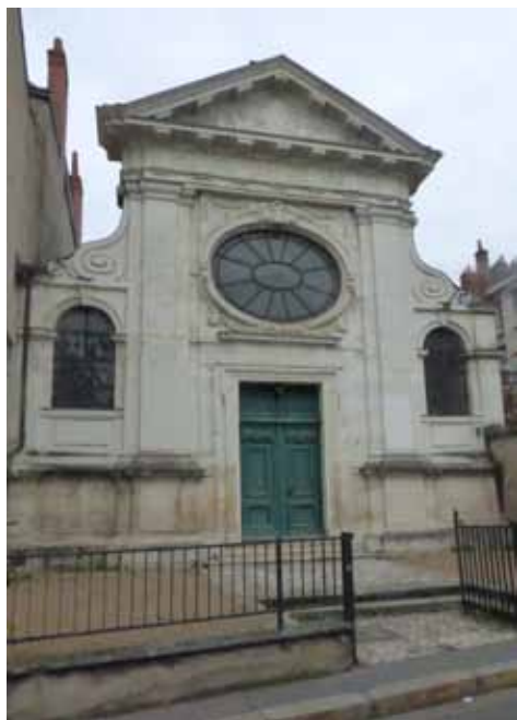
Cette chapelle est devenue le Temple de l'Eglise Réformée d'Indre et Loire

Quelques investigations supplémentaires permirent de retrouver une photo de ce portail, alors qu'il était encore implanté rue de Lucé : c'est bien la même grille que celle des Basses Rivières ; on peut y reconnaître tous les éléments actuellement visibles, sauf la mitre qui le chapeautait : elle a été probablement perdue ou remplacée car endommagée. L'origine de cette photo est la base Mérimée des Monuments Historiques, accessible sur internet ;