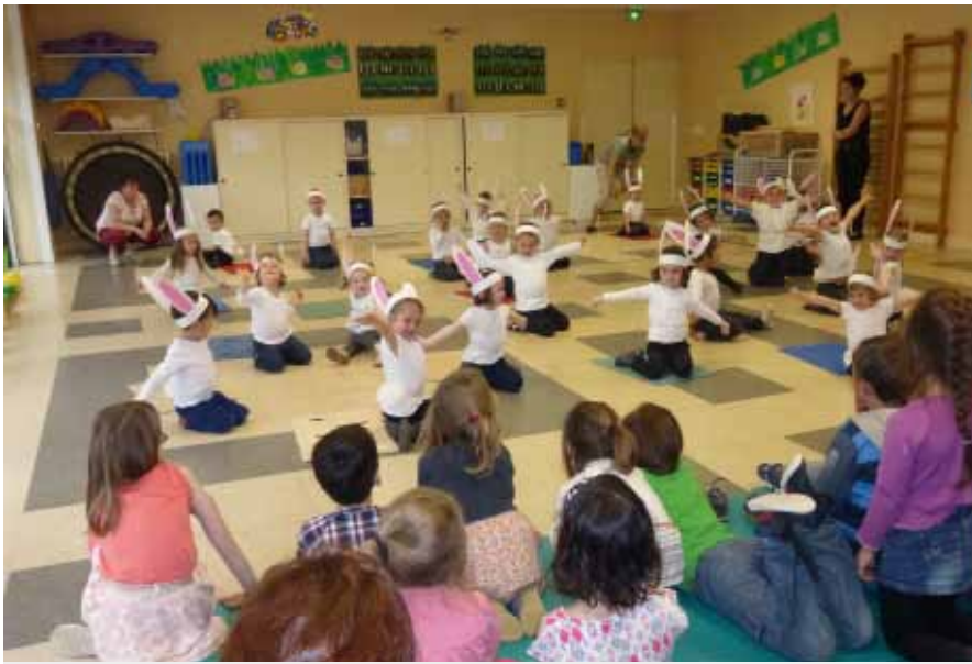
Présentation de danses

tour d'un petit « apéritif » préparé par les enfants dans une ambiance agréable et festive. Pour clore agréablement ce projet, les enfants ont assisté au spectacle «Le jardin de Badaboum et Patatras» donné par la compagnie «LéZarts vivants». L'année s'achèvera par la visite d'une ferme pédagogique à Beaumont Village pour 2 des classes, une sortie au musée de la musique de Montoire sur le Loir pour les 2 autres, des pique-niques à Rochecorbon ou Tours pour tous. Enfin, le samedi 25 juin , la fête des écoles sera l'occasion de présenter à nouveau, cette fois-ci à tous les parents réunis, les danses et créations des 4 classes, et de se produire en chorale sur le thème du « Jardin dans tous ses états ». Cette année encore, merci à tous nos partenaires, sans qui tous ces beaux projets ne pourraient se réaliser !