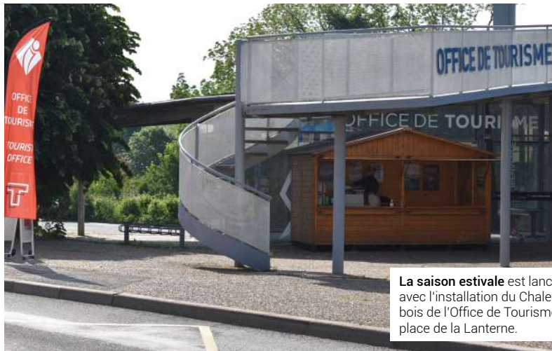
La saison estivale est lancée avec l'installation du Chalet en bois de l'Office de Tourisme place de la Lanterne.