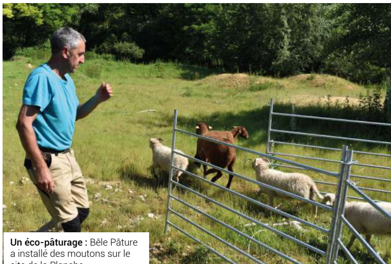
Un éco-pâturage : Béle Pâturage a installé des moutons sur le site de la Planche