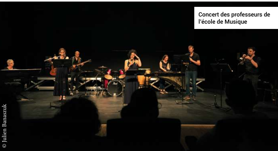
Concert des professeurs de l'école de Musique