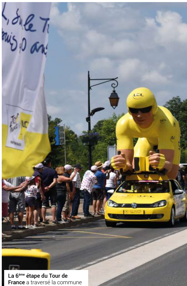
La 6 ème étape du Tour de France a traversé la commune le jeudi 1 er juillet.