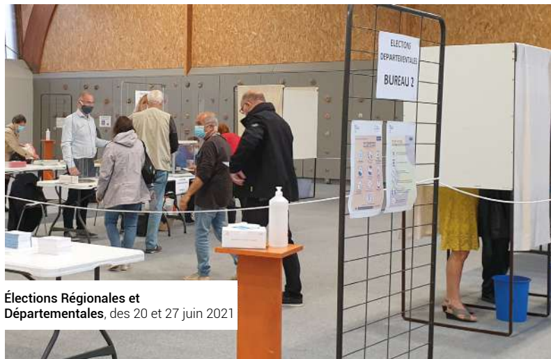
Élections Régionales et Départementales , des 20 et 27 juin 2021