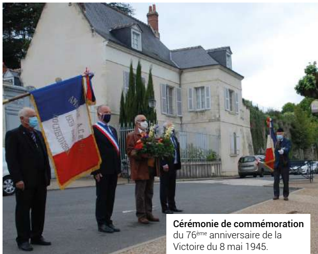
Cérémonie de commémoration du 76 ème anniversaire de la Victoire du 8 mai 1945.