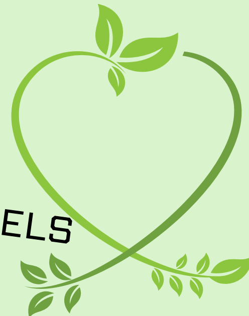
TABLEAU EN ÉLÉMENTS NATURELS